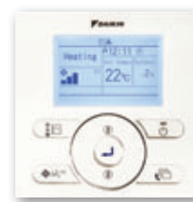
En option (BRC073)